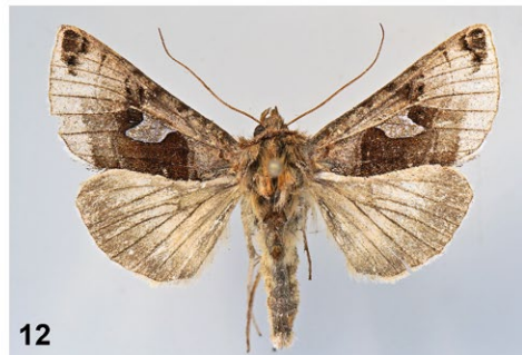
Abb. 7–12: (7) Coleophora ericarnella ; (8) Scythris limbella ; (9) Choreutis diana ; (10) Cydia corollana ; (11) Merulempista cingillella ; (12) Autographa aemula . Alle Bilder zeigen im Text angeführte Exemplare.