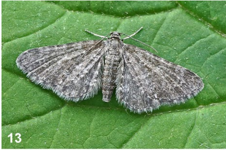
Abb. 13–15: (13) Eupithecia pygmaeata ; (14) Pamene regiana ; (15) Dichagyris flammatra . Alle Bilder zeigen im Text angeführte Exemplare.